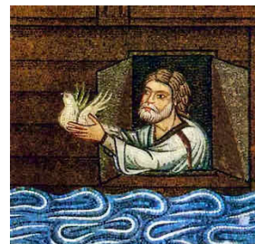
Noé envoyant une colombe. Mosaïque du XI e siècle dans la basilique Saint Marc, à Venise.