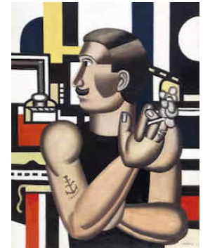
Le mécanicien (1918). Dans cette peinture de Fernand Léger, l'homme se confond avec la dimension mécanique de la machine.