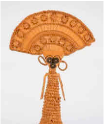
La princesse de Bali. L'un des six objets donnés par Varèse à Jolivet à l'origine de sa Suite pour piano Mana .