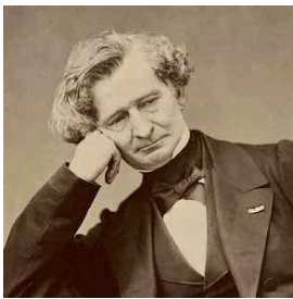
Hector Berlioz (1803-1869), membre de la Jeune-France, association d'artistes et d'intellectuels dont s'est inspiré le Groupe Jeune France, fondé en 1936.