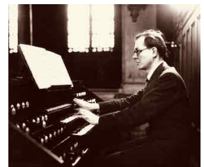
Olivier Messiaen aux claviers de l'orgue de l'église de la Sainte-Trinité, à Paris.

Figure majeure de la seconde moitié du XX e siècle, Messiaen est également issu du Conservatoire de Paris où il a pour maîtres Maurice Emmanuel, Marcel Dupré et Paul Dukas. Véritable théologien de la musique, il nourrit son œuvre de plain-chant médiéval, de chants d'oiseaux, de rythmiques indiennes et grecques, d'orientalisme (par l'usage des instruments traditionnels tel le gamelan balinaise) et de lutherie électronique (les Ondes Martenot). Théoricien, il formalise sa démarche compositionnelle dans sa Technique de mon langage musical (1944) et son Traité de rythme, de couleur et d'ornithologie (1949-1992). L'Ascension , le Quatuor pour la fin du Temps , Vingt Regards sur l'Enfant-Jésus , la Turangalila-Symphonie , la Messe de la Pentecôte et l'opéra Saint François d'Assise figurent parmi ses œuvres les plus significatives. Son enseignement au Conservatoire national supérieur de musique de Paris constituera un facteur déterminant dans l'élargissement de sa notoriété à l'échelle internationale.