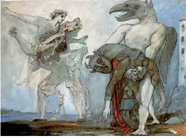
La dépouille du Minotaure en costume d'Arlequin. Pablo Picasso (1936).

Dans les années 50 et 60, une telle orientation ne pouvait qu'être critiquée par une avant-garde dont la nature totalitaire et anhistorique n'est plus un secret 11 . La lutte sera âpre, comme le rappelle le conflit Boulez/Jolivet qui finit par en venir aux mains 12 . D'autres paieront le prix fort, comme Rolande Falcinelli, par exemple, toujours mise à l'index aujourd'hui en France, malgré des pièces remarquables vivifiées par la tradition savante iranienne. Par bien des aspects, elles annoncent Les Laudes de Jean-Louis Florentz, inspirées du Kidân Zanganeh, ou « Office du matin » de la liturgie orthodoxe éthiopienne.