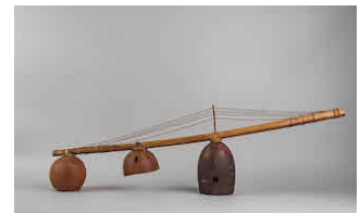
Autre instrument traditionnel gabonais : le mvet , harpe-cithare à trois Calebasses. Ce terme désigne aussi les récits épiques déclamés par un barde appelé mbom-mvett .

Cette perspective éclaire les musiques d'initiation où le chant et l'instrument participent pleinement à l'économie du sacré. Le ngombi 5 , harpe sacrée du Gabon, mérite à cet égard une mention particulière. Son timbre clair, sa résonance ample, sa capacité à soutenir le chant en font un instrument de passage, une charnière entre la parole humaine et la mémoire ancestrale. Autour de lui, les voix se déploient, le chœur répond, les percussions scandent et l'ensemble forme une architecture sonore d'ordre cosmique. La musique n'y est pas seulement « art du beau » : elle est une manière d'habiter l'invisible, de donner au rite sa profondeur sensible et sa cohérence intérieure. Cette dimension diachronique de la musique Kota s'impose avec force : loin d'être un divertissement profane, elle est une mémoire en acte, une archive sonore qui transmet une ontologie rythmique du monde. Les répétitions hypnotiques, les polyrythmies subtiles et l'intensité croissante opèrent une transfiguration du temps ordinaire, reliant les vivants aux esprits ancestraux dans une « liturgie organique ». Léopold Sédar Senghor y voit l'essence d'un art « vital » qui refuse la dissociation moderne entre esthétique et existence : « Le rythme est le fond même de notre style 6 ». Ainsi, la musique n'accompagne pas le reliquaire ; elle le réveille, lui donne voix, et inscrit la communauté dans une durée spirituelle où les morts continuent d'habiter l'horizon des vivants.