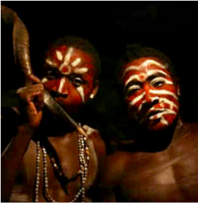
Musiciens traditionnels gabonnais lors d'une cérémonie Bwete . L'un joue du Poungui , en corne de buffle.

Les mélodies reposent sur de brèves cellules mélodiques, des contours souples et des inflexions plus que sur des progressions harmoniques. Le timbre, l'attaque, les glissements, les retards, les appuis y comptent autant que les hauteurs elles-mêmes. Le mode devient alors bien davantage qu'une structure musicale : il crée un climat spirituel, une manière d'habiter le son et le temps. Il donne au chant sa couleur spirituelle et au rite son épaisseur sensible.