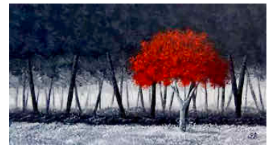
Rouge Silence Bruno Lemasson pinxit "L'arbre devient la trace de ce qui demeure et reste debout"