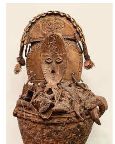
M'bulu N'Gulu . Panier reliquaire Kota-Obamda. Coll. Paul Desnouck.

Chez les Kota, notamment parmi les Mahongwé et les Ndumu, ces figures veillent sur des paniers contenant les reliques des ancêtres illustres. Mais la fonction du reliquaire dépasse la conservation matérielle : elles assurent une continuité entre les générations et maintiennent vivant le lien entre les vivants et les morts. Les anciens ne disparaissent pas, mais demeurent présents dans la mémoire lignagère et dans l'ordre du rite. Le métal, appliqué sur le bois, concentre la valeur symbolique de l'objet, affirme sa puissance et intensifie sa présence visuelle. Son éclat attire et maintient une distance, comme si la beauté devait ici préserver l'altérité du sacré. Cette dramaturgie du seuil trouve son prolongement dans les pratiques du bwete 3 . Les cérémonies liées aux reliquaires accompagnent les funérailles, les initiations, les conflits ou les grandes décisions du lignage. Elles se déroulent généralement de nuit, dans un espace rituellement préparé pour accueillir la parole des ancêtres. Là, les libations, les purifications, les invocations et les récitations de noms réactivent la circulation symbolique entre les morts et les vivants, ils rendent à la mémoire sa force agissante.