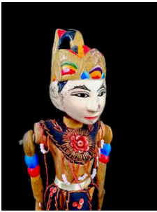
Marionnette Wayang Golèk Abimanyu (Indonésie).

Elle interroge ainsi le mystère même de l'incarnation : qu'est-ce qu'un corps animé ? Qu'est-ce qu'une présence ? Comment une forme façonnée par la main humaine peut-elle, soudain, paraître animée d'une vie propre ?