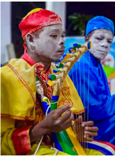
Cérémonie rituelle Bwete . Le musicien joue de la harpe sacrée, le ngombi .